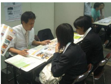
〈福祉の就職フェア〉

また、こうした恵まれた就職状況の中でも、1 年次の最初から 2 年間にわたり、 常駐のキャリアコンサルタント が 就職指導・面談 を行い、最終目標である介護福祉施設等への就職へと導きます。